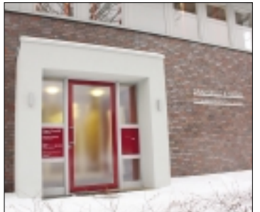
Mitte Dezember konnten die Mitarbeiter der Steuerberatungsgesellschaft „Dransfeld & Harms“ ihre neuen Büros beziehen.

miten, doch als die Arbeiten Ende 2007 starten sollten, kamen unvorhersehbare Baumängel zutage. Ein Abriß war schließlich die einzig sinnvolle Lösung. →