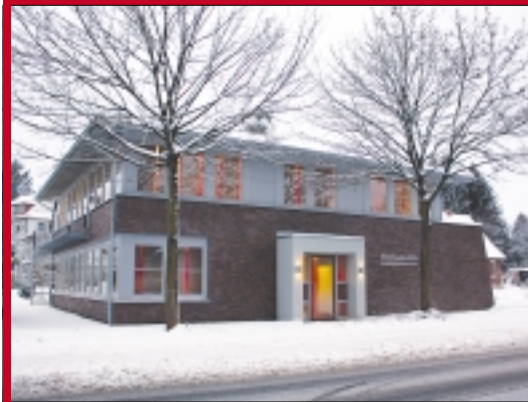
Das neue Bürogebäude fügt sich harmonisch in das Umfeld der Harburger Straße ein.